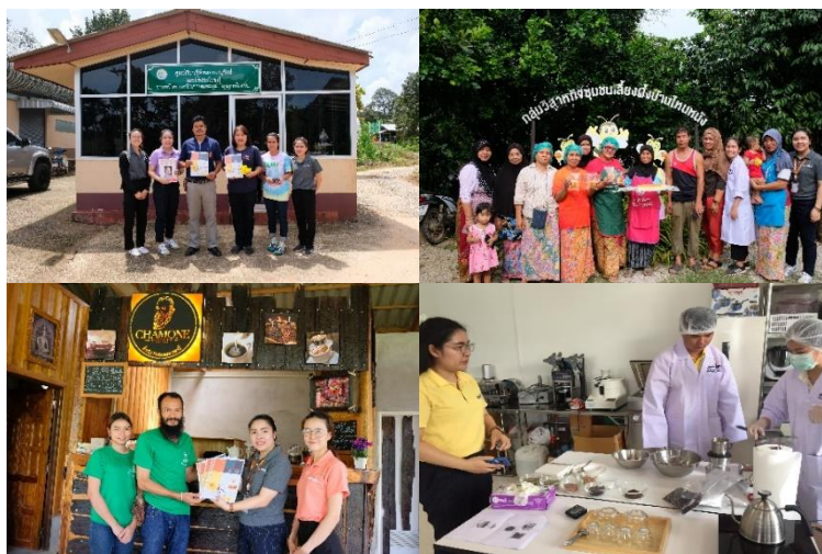
ภาพการดำเนินงาน

ชุมชนกลุ่มผลิตภัณฑ์อาหาร (กาแฟ น้ำผึ้ง) ที่เข้าร่วมโครงการ จะได้รับองค์ความรู้ด้านการผลิต การควบคุมคุณภาพ มาตรฐานผลิตภัณฑ์ต่างๆ ที่เกี่ยวข้อง ความรู้ในการพัฒนาการสร้างมูลค่าเพิ่มของผลิตภัณฑ์ให้ออกสู่ตลาดทั้งในและต่างประเทศ จากองค์ความรู้ด้านวิทยาศาสตร์และเทคโนโลยีการอาหารที่ถูกต้อง ช่วยให้ผลิตภัณฑ์เป็นที่ยอมรับของผู้บริโภค ก่อให้เกิดการเสริมสร้างผลิตภัณฑ์ใหม่ๆ ที่มีคุณภาพและมาตรฐาน ทั้งยังเป็นการส่งเสริมและเสริมสร้างศักยภาพของชุมชน กลุ่มผลิตภัณฑ์อาหาร (กาแฟ น้ำผึ้ง) เกิดการสร้างงานในชุมชน ทำให้เกิดการสร้างรายได้ที่เพิ่มขึ้น เพื่อนำกลับไปฟื้นฟู ทรัพยากรชีวภาพในชุมชนต่อไป