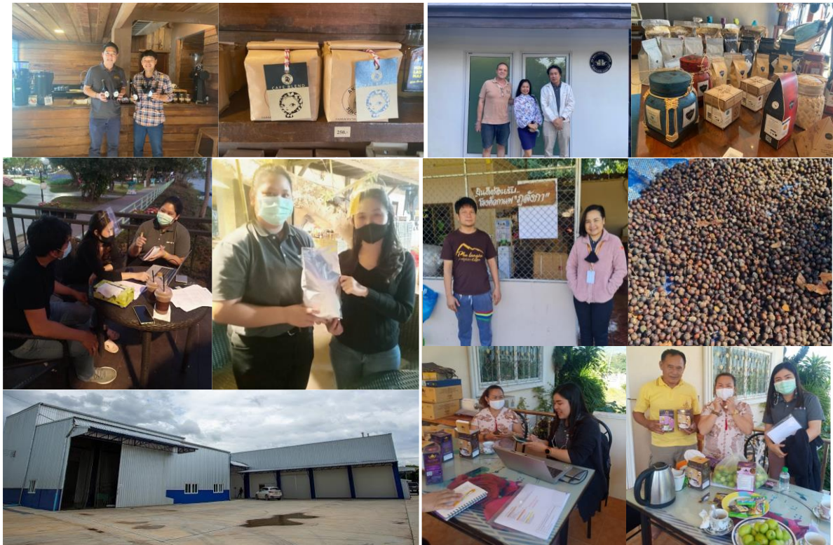
ภาพการดำเนินงาน