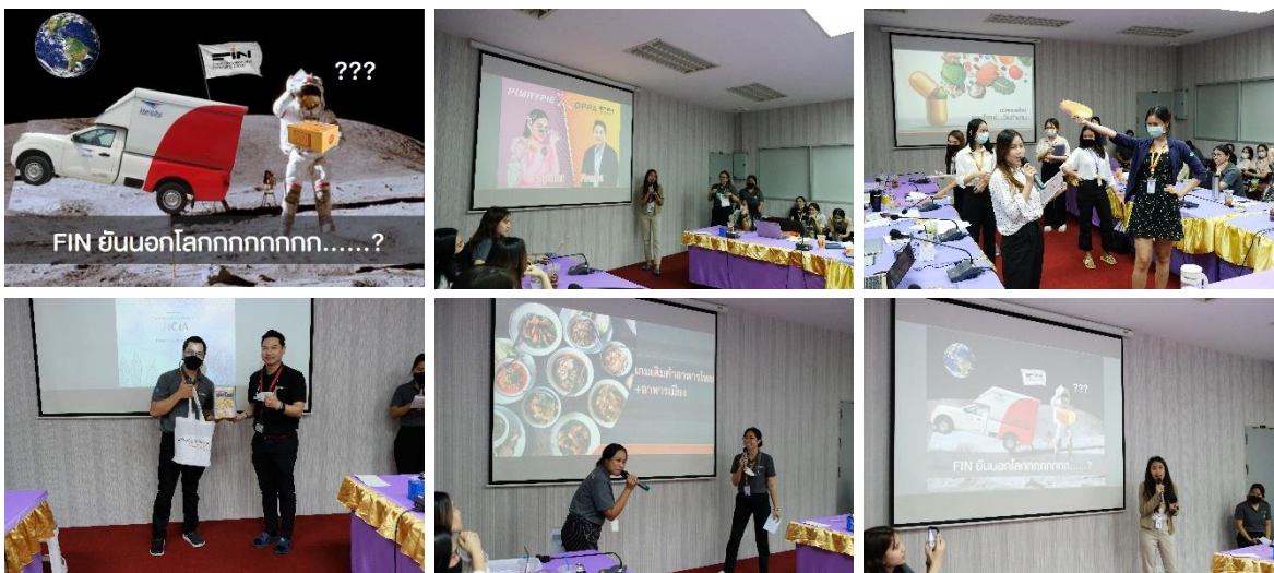
ภาพที่ 2 กิจกรรม Knowledge Sharing เพื่อกระตุ้นการสร้างนวัตกรรมในองค์กร