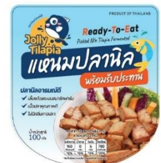
ภาพตัวอย่างผลิตภัณฑ์